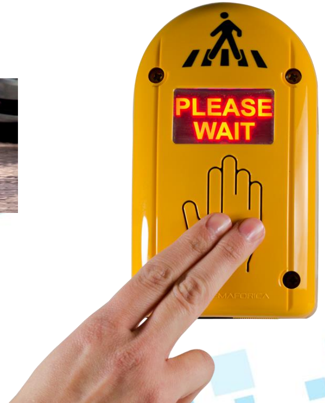
Botones para Demanda Peatonal

El sistema contará con elementos tecnológicos que mejoran las condiciones de accesibilidad y seguridad de los ciudadanos y visitantes de Armenia.